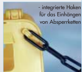
- integrierte Haken für das Einhängen von Absperrketten

Klappbar und mit zwei Haken zum Einhängen von Ketten ausgerüstet.