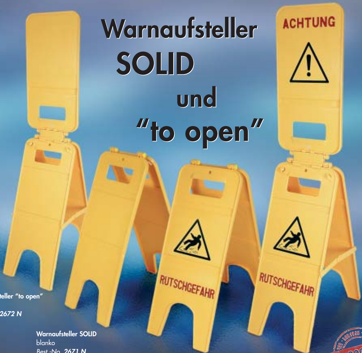
Warnaufsteller "to open" blanko Best.-No. 2672 N